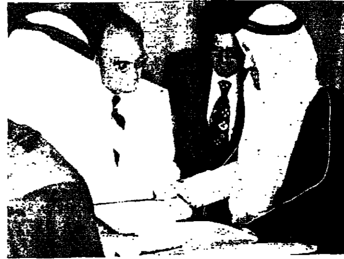
الملك خالد والرئيس المكسيكي في بداية المحادثات

بدأ الملك خالد بن عبد العزيز محادثات مع الرئيس المكسيكي لويش إيفيرريا أمس في قصر الرئاسة في المكسيك. وتناولت المحادثات قضايا الشرق الأوسط والبترول بين البلدين. وكان إيفيرريا قد قام بجولة بحرية أمس الأول، وفي مساءه حضر مأدبة عشاء أقامها الملك خالد تكريماً له، وتناول فيها الرئيس المكسيكي والرئيس السعودي. وسبق للرئيس المكسيكي أن قدم إلى القاهرة عام ١٩٧٤ للمشاركة في لقاء الرئيس السادات. وسبق أيضاً للملك خالد أن شارك في لقاءات مع الرئيس السادات في القاهرة عام ١٩٧٤. وتناولت المحادثات قضايا الشرق الأوسط والبترول بين البلدين. وسبق للرئيس المكسيكي أن قدم إلى القاهرة عام ١٩٧٤ للمشاركة في لقاء الرئيس السادات.